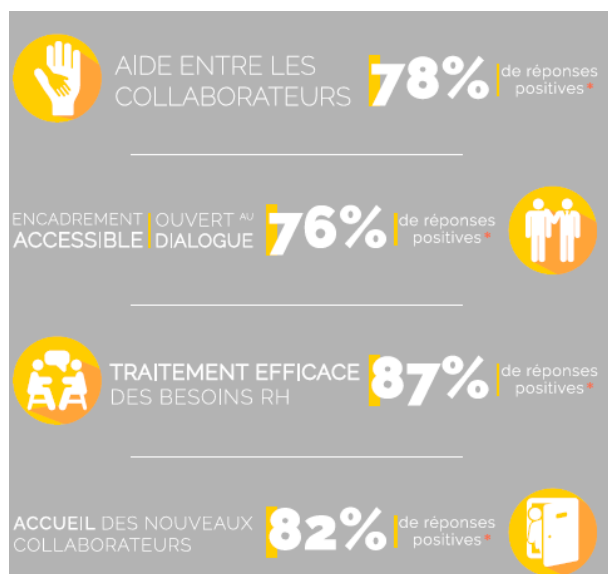
Figure 2 Extrait de notre enquête de satisfaction collaborateur 2017

L'évaluation est discutée avec le collaborateur et son responsable et un plan d'action au cas par cas est discuté conjointement. De plus, une synthèse annuelle est réalisée par la Direction des Ressources Humaines et un plan d'action en découle pour améliorer la satisfaction globale de nos collaborateurs.